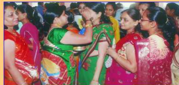
સંઘપૂજન કરતા શિવાબેન છેડા