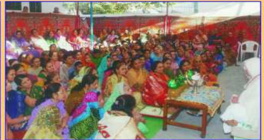
પૂજ્યશ્રીનું વ્યાખ્યાન સાંભળતો સંઘ