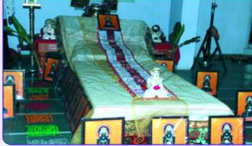
જિનાલયના રજતવર્ષની ધ્વજ