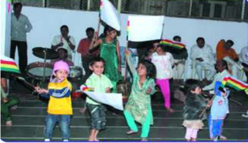
રજતવર્ષની ધ્વજની સલામી આપતા બાળકો