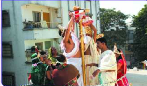
જિનાલયનો ૨૫મો ધ્વજરોહણ