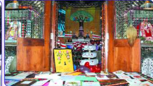
શ્રી અલૌકિક પાર્શ્વનાથના દરબારે ૨૫મી વર્ષગાંઠે ભેટ