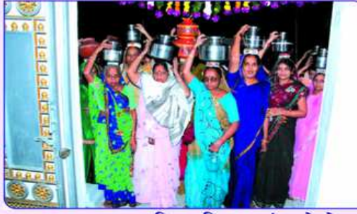
જલયાત્રાના પવિત્ર વિધાનમાં બહેનો