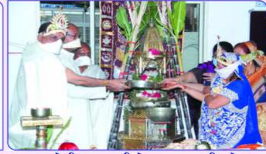
સત્તરભેદી પુજા-શ્રી દેવજી પુનશી મોતા